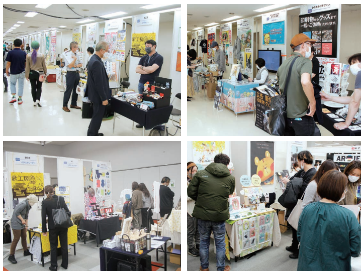
※写真は全て過去に開催されたクリエイターゾーンの様子

本展示会は1981年に産声を上げた、オリジナルグッズづくりのプロが集まる展示会です。会場には、印刷やスタンピング、Tシャツプリント、雑貨などをオリジナルで小ロット加工するための機器や商材が多数展示され、近年は約2,000名の来場者が全国から訪れています。Tシャツ、スマートフォンケース、缶バッジ、名刺といったオーダーグッズづくりの現場では、イラストやロゴマーク、写真画像などのデザインコンテンツが欠かせません。また、それらの製造システムや無地商材のメーカーも、販促用サンプルに使うイラストなどを求めています。そこでオーダーグッズビジネスショーでは、それらのデザインコンテンツを求める企業と、クリエイターの皆さまの出会いの場として「クリエイターゾーン」を設けています。デザイナー、クリエイター、フォトグラファーなどの皆さまに、ぜひご出展をいただき、新しいビジネスや人脈の拡大にご活用いただければ幸いです。